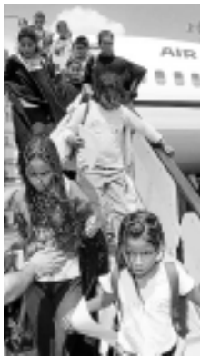
La única solución justa para el conflicto sahariano es un referéndum de autodeterminación

Sabemos que vuestra experiencia es la de haber recibido mu-